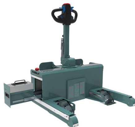
MobilLit V5 – option batterie lithium interchangeable