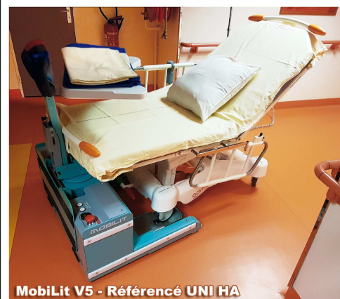
MobilLit V5 - Référencé UNI HA