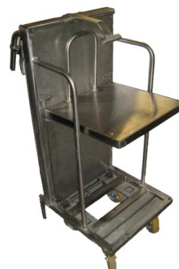
En inox, hauteur constante