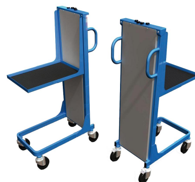
Hauteur constante réglable

15, Chemin des Églantiers - ZA de la Ronze 69440 TALUYERS Tél. 04 78 48 13 26 - Fax: 04 78 19 33 90 contact@adap-table.com