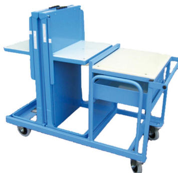
Double hauteur constante