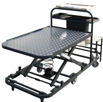
Aluminium, hauteur constante