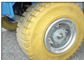
Pneus non marquants