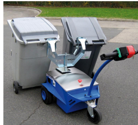
Collectivités et Hôpitaux